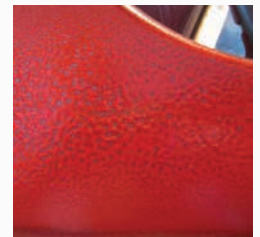
« Cratérisation » ou « yeux de poisson » sur une surface métallique