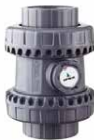
Clapet à boule SXE Dimensions : 1/2 à 4 pouces