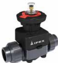
Robinet à membrane à commande manuelle DK Dimensions : 1/2 à 2 1/2 pouces