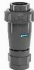
Purgeur d'air VA Dimensions : 3/4, 1 1/4 et 2 pouces