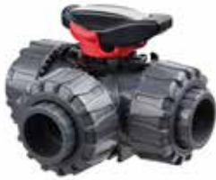
Robinet à tournant sphérique à 3 voies TKD Dimensions : 1 à 2 pouces