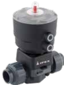
Robinet à membrane à commande pneumatique DK Dimensions : 1/2 à 2 1/2 pouces