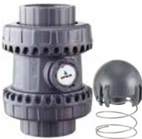
Clapets de non-retour à ressort SSE Dimensions : 1/2 à 4 pouces