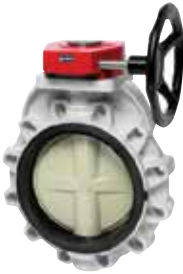
Robinet à papillon FK Dimensions : 1 1/2 à 16 pouces