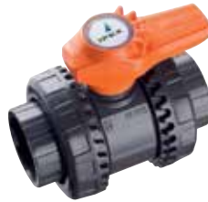
Robinet à tournant sphérique VXE Dimensions : 1/2 à 6 pouces