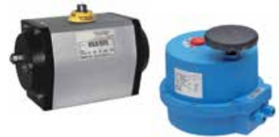
Actionneurs pneumatiques et électriques résistants à la corrosion 1/2 à 16 pouces