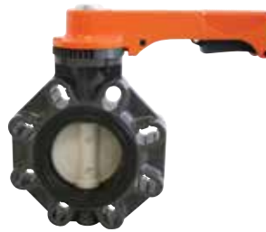
Robinet à papillon FX Dimensions : 1 1/2 à 12 pouces